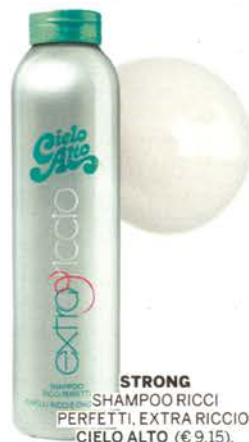
STRONG SHAMPOO RICCI PERFETTI. EXTRA RICCIO. CIELO ALTO (€ 9,15).