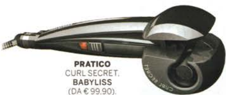
PRATICO CURL SECRET. BABYLISS (DA € 99,90).