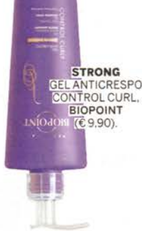
STRONG GEL ANTICRESPO CONTROL CURL. BIOPPOINT (€ 9,90).