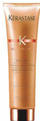
STRONG K DISCIPLINE OLEO CURL. CRÈME DE SOIN. KÉRASTASE (€ 27,90 IN SALONE).